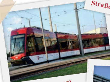
Der Tramino (2015)