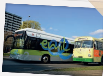
Elektrobus Emil (2014) Anderthalbdecker Heinrich (1965)