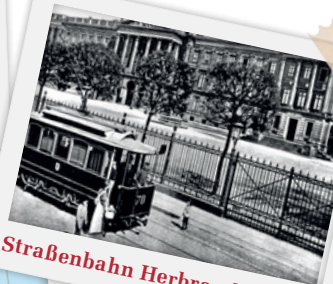
Straßenbahn Herbrand (1899)